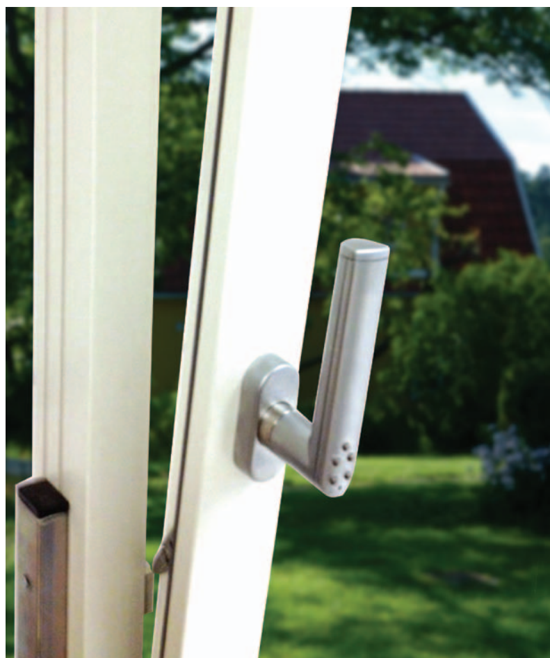
Modalità di ventilazione (bloccato o sbloccato)