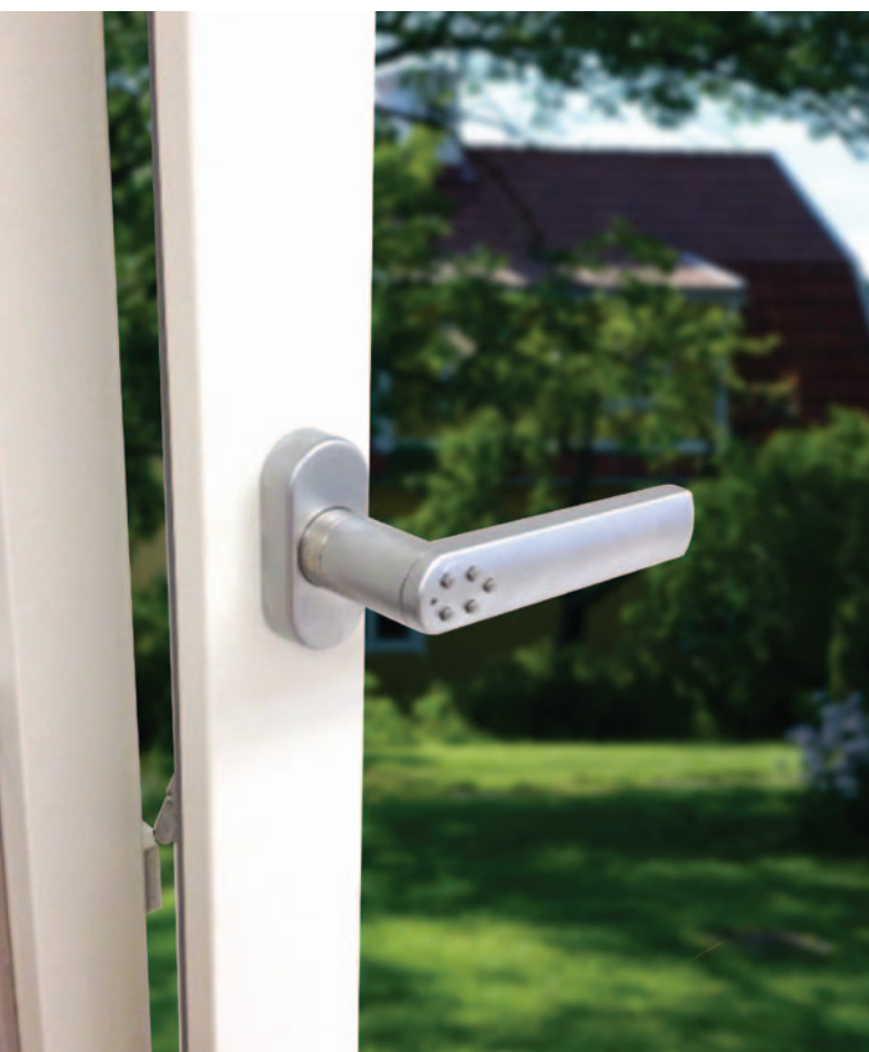
Aperto / sbloccato